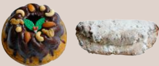
A. クグロフ or B. シュトーレン